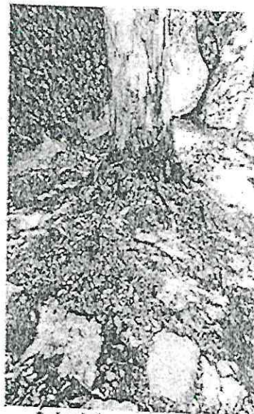
Arbol 1 para derribo