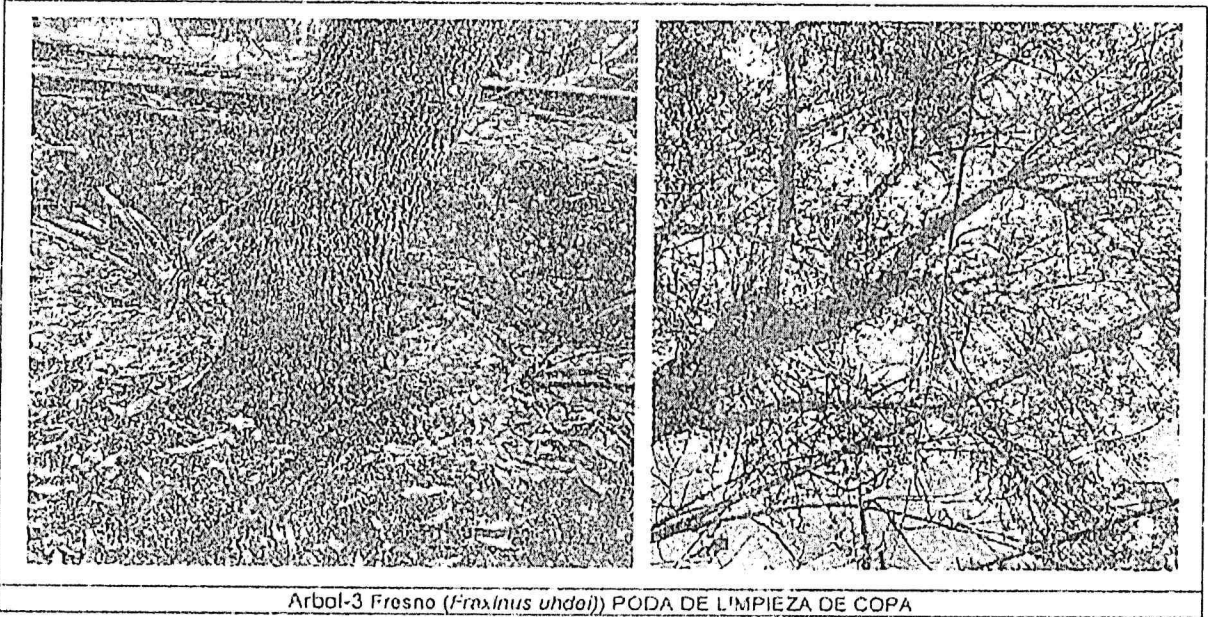
Arbol-3 Fresno ( Fraxinus uhdei ) PODA DE LIMPIEZA DE COPA