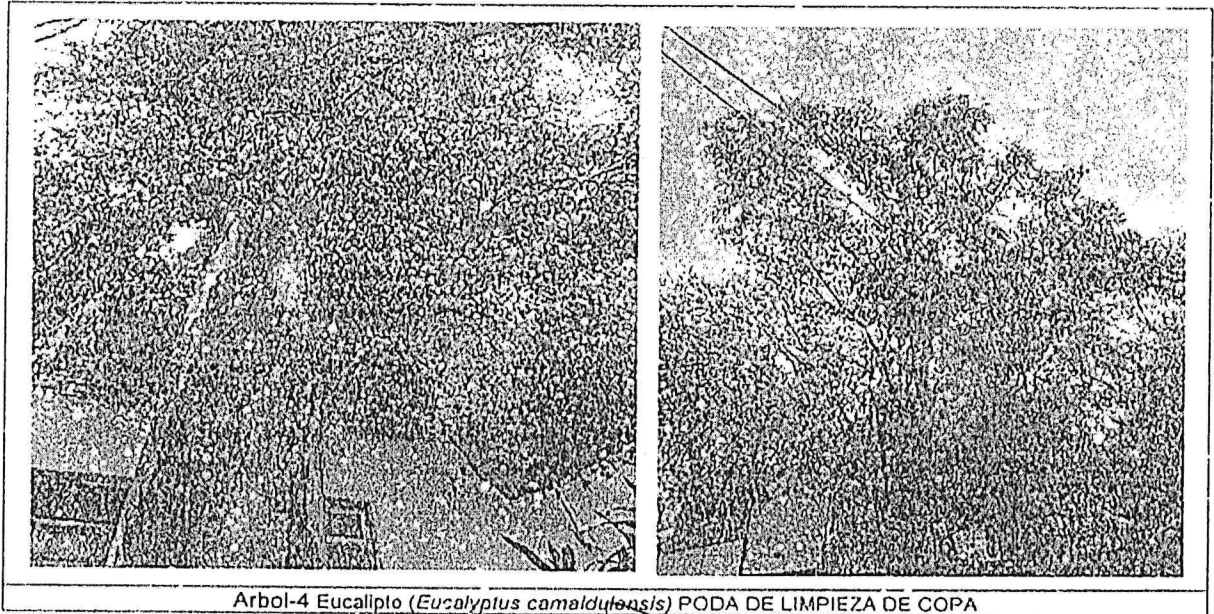
Arbol-4 Eucalipto ( Eucalyptus camaldulensis ) PODA DE LIMPIEZA DE COPA