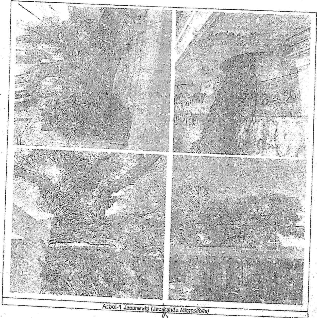
Arbol-1 Jacaranda (Jacaranda mimosifolia)