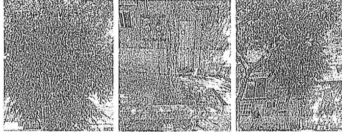
Árbol 2, poda de limpieza de copa (<16%)