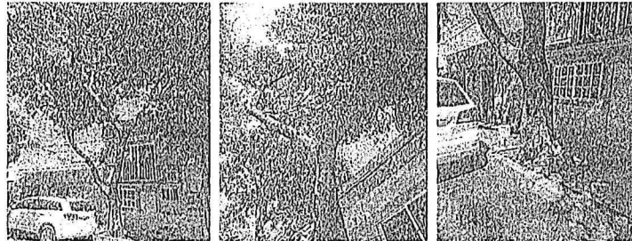
Árbol 2, poda de limpieza de copa (<16%)