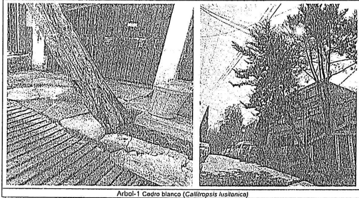
Arbol-1 Cedro blanco ( Callitropsis lusitanica )