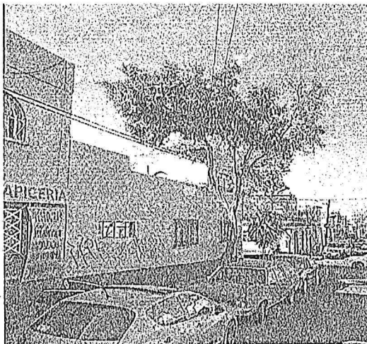
Imagen tomada de Google Maps diciembre 2022 el árbol se realizó una mala práctica de poda en el árbol

Imagen tomada de Google Maps marzo 2020 el árbol presentaba buena estructura y condición general