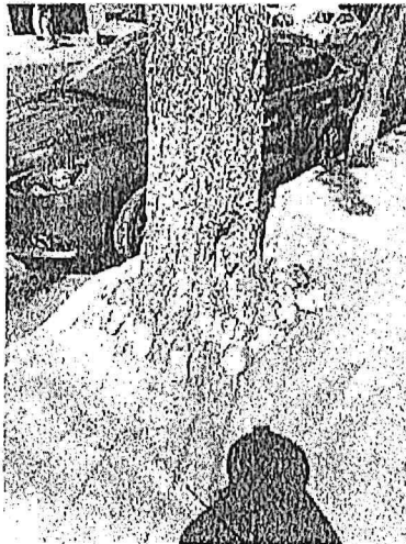
Archivo fotográfico Árbol 1, poda de limpieza de copa (<15%)