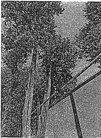
Árbol 1, poda de limpieza de copa (<20%)