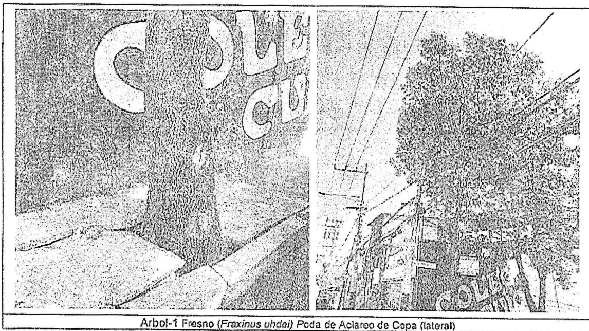
Arbol-1 Fresno ( Fraxinus uhdei ) Poda de Aclareo de Copa (lateral)