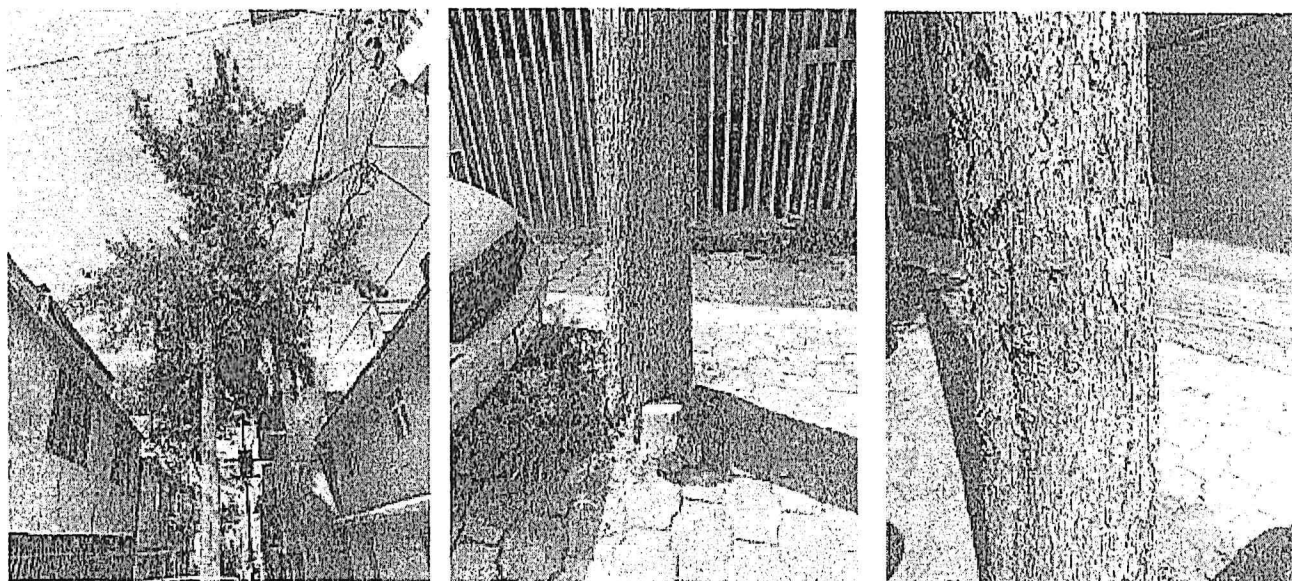
Árbol 2. Poda de limpieza de copa (<15%)