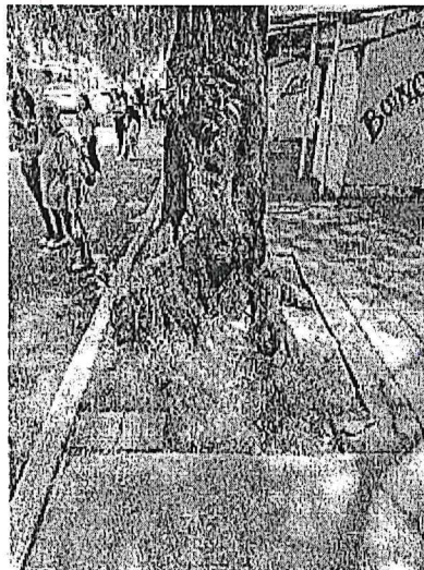
Árbol 3, poda de limpieza y elevación de copa (<20%)