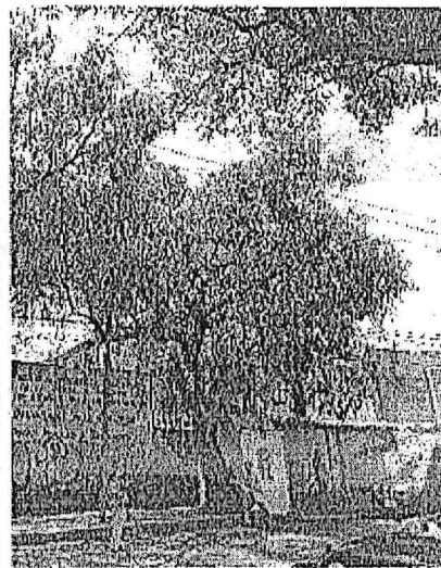
Árbol 4, poda de limpieza y elevación de copa (<20%)