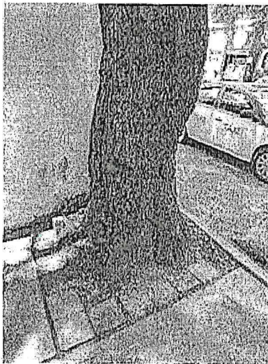
Árbol 1, poda de limpieza y elevación de copa (<20%)