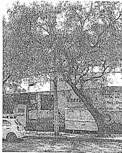
Árbol 2, poda de limpieza y elevación de copa (<20%)