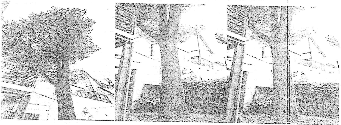
Árbol 1- Liquidámbar Liquidambar styraciflua