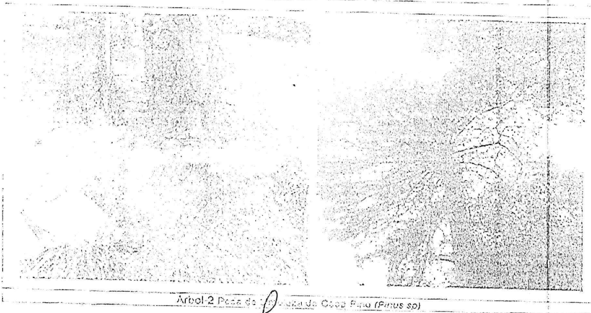
Arbol-2 Pasa de la Cruz de Copal Pino (Pinus sp)