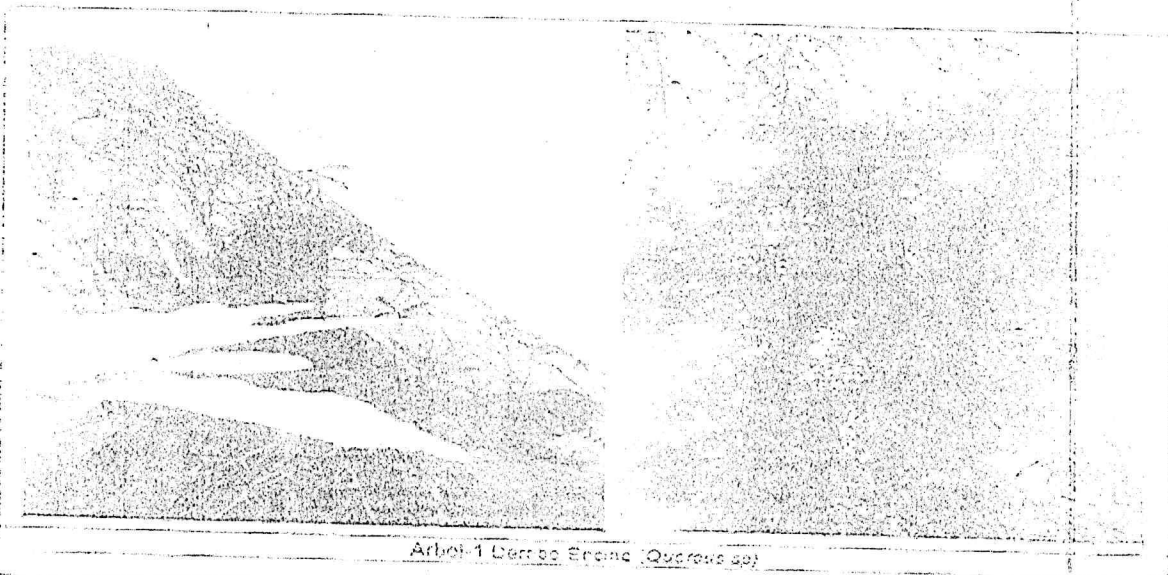
Arbol-1 Derrape Espino (Quercus sp)

Con base en los artículos 75 numeral V de la Ley Orgánica de las Alcaldías, Artículos 106, 109, 110, 111 y 112 de la Ley Ambiental de la Ciudad de México y demás relativos de la Norma Ambiental para el Distrito Federal NADF-001-RNAT-2015, se emite el siguiente: