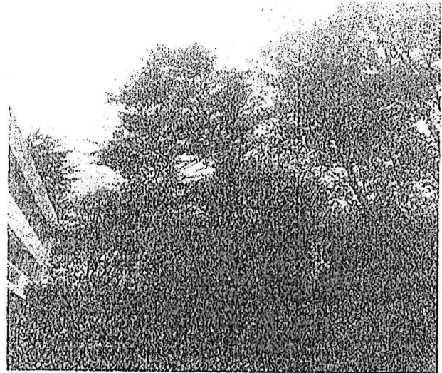
Arbol-1 Poda de Limpieza de Copa (<15%) Pino( Pinus sp )