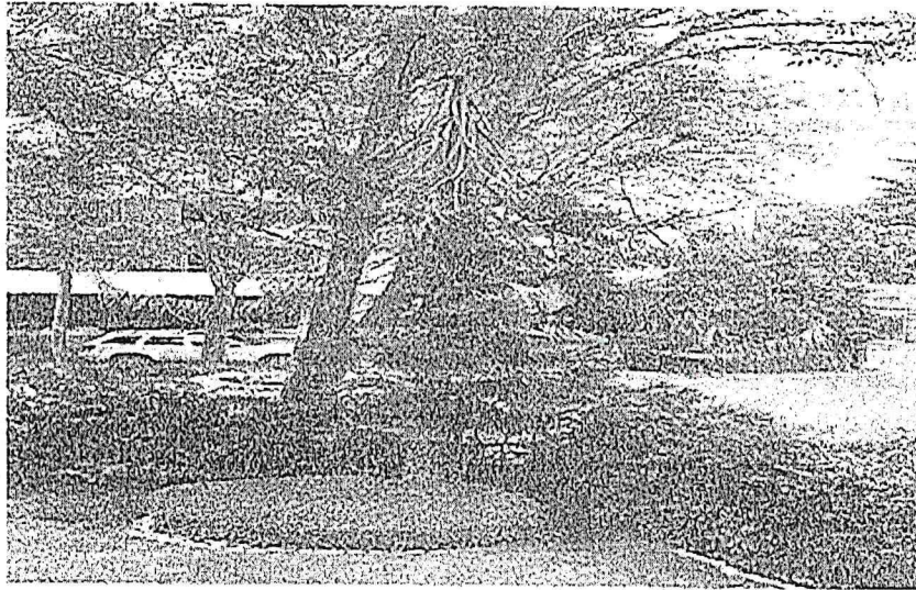
Arbol-2 Poda de Limpieza de Copa Araucaria (<10%) (Araucaria heterophylla)