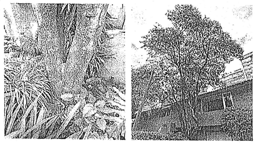
Árbol 1, poda de limpieza de copa (<15%)