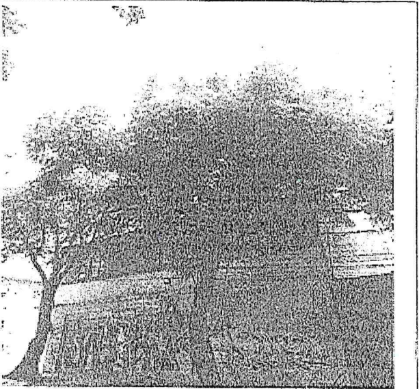
Arbol-2 Jacaranda ( Jacaranda mimosifolia )