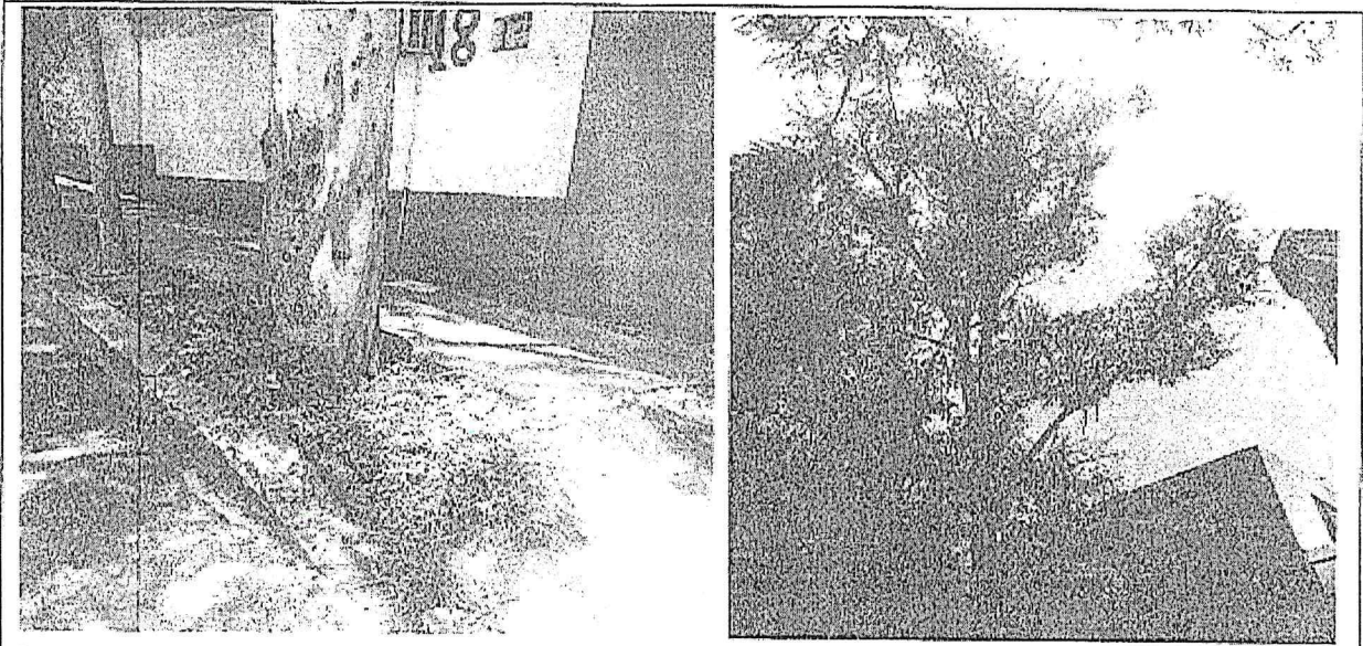
Árbol-1 Eucalipto ( Eucalyptus camaldulensis ) NO REQUIERE MANEJO