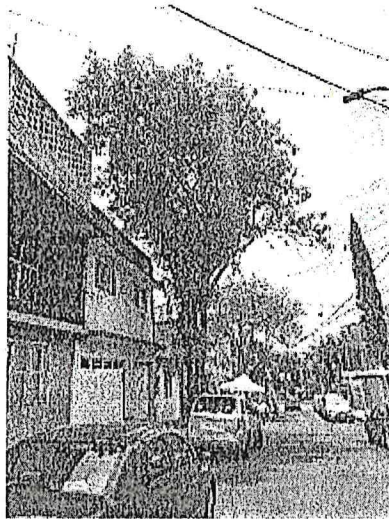
Árbol 1, poda de limpieza de copa (<15%)