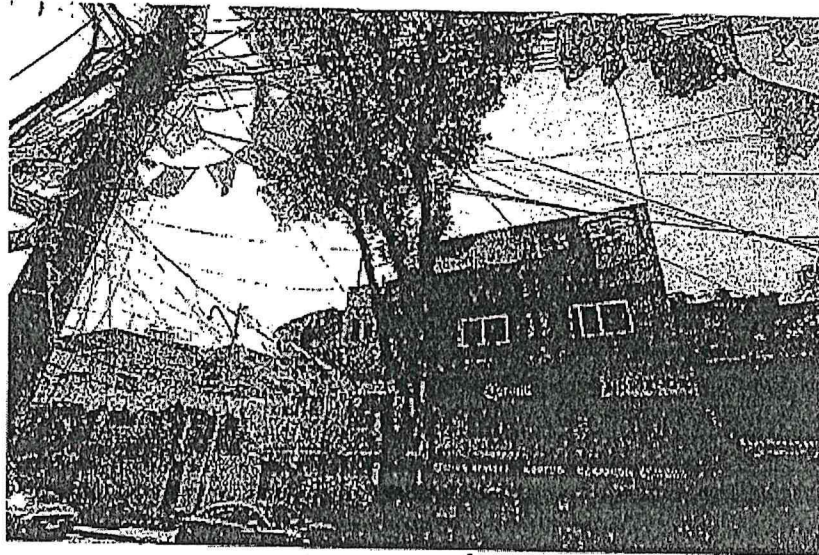
IMAGEN DEL ÁRBOL

DESCRIPCIÓN DEL ÁRBOL. – Se trata de un árbol de nombre común fresno con dimensiones aproximadas de 80 centímetros de diámetro y 10.00 metros de altura, con abundante follaje y varias ramificaciones, ubicado en Eliminado el domicilio sobre la banqueta y guarnición de concreto.