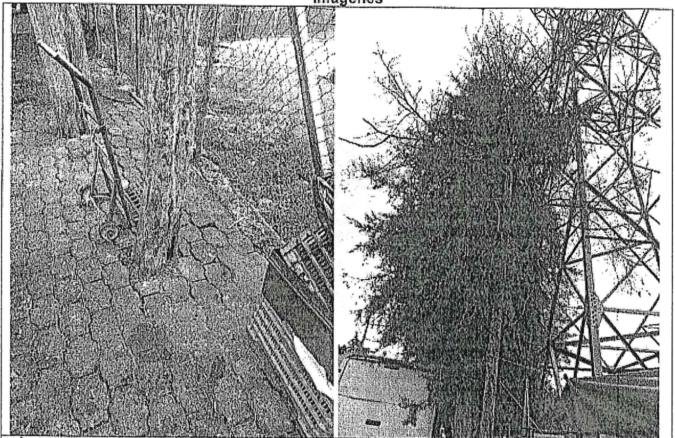
Árbol 1. Se observó un árbol muerto en pie con inclinación de alrededor de 10° sin corteza, con follaje de aspecto rojizo. Se requiere derribo de acuerdo con el numeral 7.4.1.1 Muertos en pie.