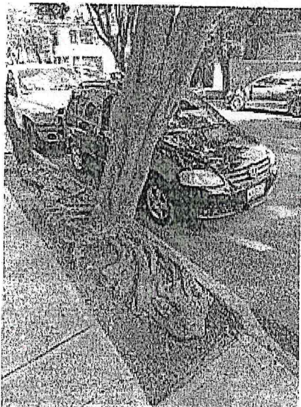
Árbol 1, poda de limpieza de copa (<20%)