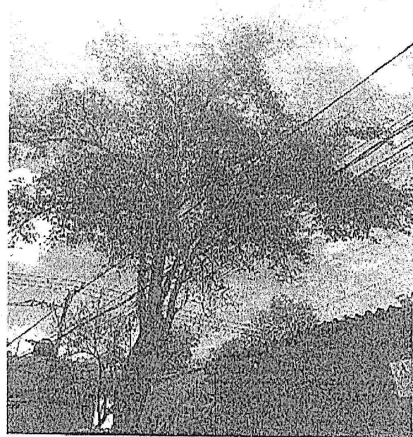
Arbol-2 Poda de Limpieza de Copa (<15%) Fresno ( Fraxinus uhdei )