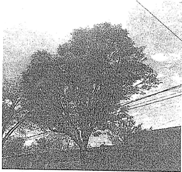
Arbol-1 Poda de Limpieza de Copa (<15%) Fresno ( Fraxinus uhdei )