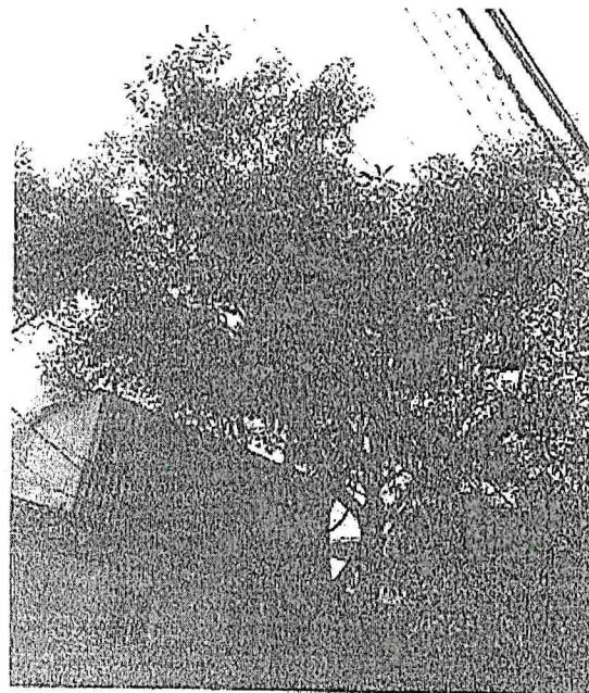
Árbol-1 Poda de Reducción de Copa (<15%) Hule ( Ficus elastica )